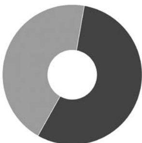
● ANO – 55,4% ● NE – 44,6%

1. Setkali jste se již s neetickým jednáním ze strany jiné doprovodné organizace?