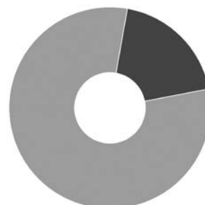
● ANO – 19,2% ● NE – 80,8%

3. Považujete za vyhovující současné legislativní zakotvení tzv. „příbuzenské“ pěstounské péče, resp. její zařazení do oblasti pěstounství, ale s nesrovnatelně nižšími nároky na pečující, než je tomu u jiných typů pěstounství?