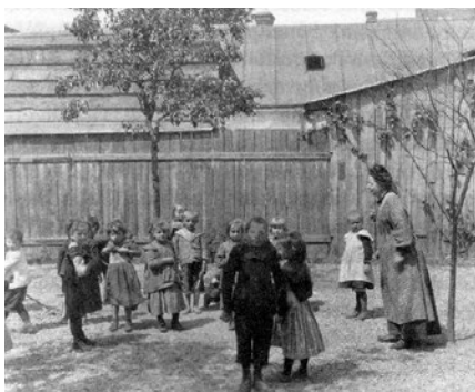
Na fotografii je zachyceno první sídlo před rokem 1918 na adrese Friedrich Kaisergasse 51, Malleier: The Ottakringer Settlement , 30

vzbuzuje a nesmírně těší. Nepřijde-li dítě, vyhledá se v bytě a při onemocnění pošle se pro lékaře. Vedle dětí přijímají se do settlementu učni a učnice, matky a celé rodiny. Zařizují se pro ně hudební a umělecké dýchánky, učí se správně dívat na umělecká díla, podávají se jim vysvětlivky, rady a pokyny v nejrůznějších záležitostech, upravují se jim byty a opatřuje se jim radost a způsobuje štěstí vpravdě velmi delikátně. Tak například o Vánocích nepřipravuje se pro ně společná slavnost v settlementu, nýbrž tolik stromků vánočních se nakoupí, kolik rodin je členy settlementu, a ty ozdobené s přídavkem dárků pro každého člena donesou se do obydlí, aby rodiny doma v kruhu vlastním svatvečer slavily. Cítíte ten rozdíl mezi naším podělováním vánočním a způsobem, jaký panuje v settlementu? Ano, v pravdě veliké srdce musí míti ten kdo volí se pracovat settlementu (-až. 1905).